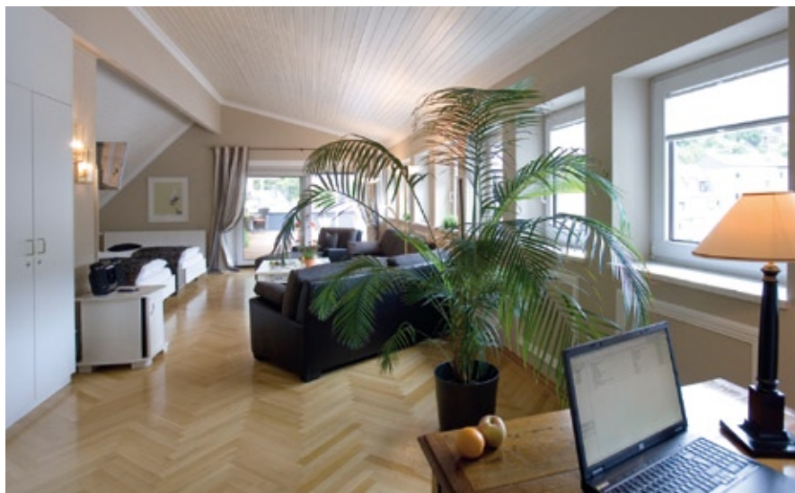
Blick in die Business-Suite mit Dachterrasse.

Die Cadio Mosel-Eifel-Klinik ist auf diese individuellen Wünsche ihrer Patienten mit den sogenannten Wahlleistungen eingerichtet und bietet in Kombination mit der hochspezialisierten Medizin exklusive Unterbringung mit vielen Service-