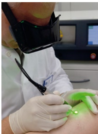
Laser-Präzision mit Lupenbrille.

teile des Laser-Eingriffs mit dem minichirurgischen, sogenannten narbenfreien Verfahren (minichirurgische Phlebektomie = Entfernung der Astkrampfadern), kombiniert. Bei der ELT wird die Stammvene nicht herausgezogen, sondern durch den Laserstrahl verschweißt und ausgeschaltet. Diese Behandlung wird in der Regel ambulant durchgeführt.