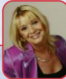
Cindy Berger: © Premium Promotion